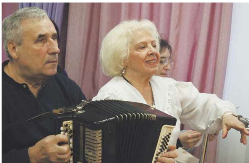
Песни и музыка объединяют поколения