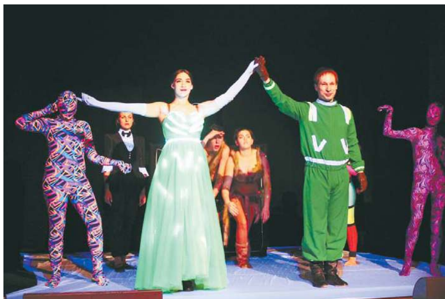
Премьера прошла с успехом

«Все декорации мы делали сами, продумывали, обсуждали, репетировали и