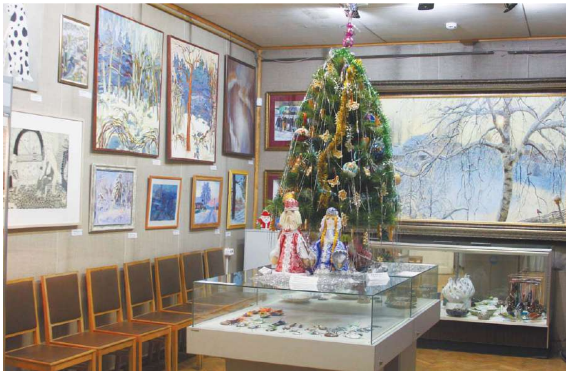
В «Усадьбе «Костино» царит новогоднее настроение

Зима – время года и чистое состояние души, от классической обманки «Новогодний карнавал» Марии Моторовой до абстрактно выразительного «Зимнего вечера» Анны Неизвестной. А между ними фантастическое смешение стилей, направлений, техник. И каждый художник узнаваем и неповторим. Загораживают необычные «Сосны Загорянки» признанного мастера Игоря Хи-