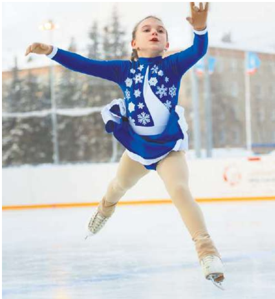
Юные фигуристы опробовали лёд

Каток у ЦДК и прокат работают ежедневно с 8 утра до 11 вечера, одновременно с комфортом покататься могут чуть более 70 человек. «Между сеансами массового катания мы выдерживаем совсем небольшие промежутки — 20 минут, это время нужно для того,