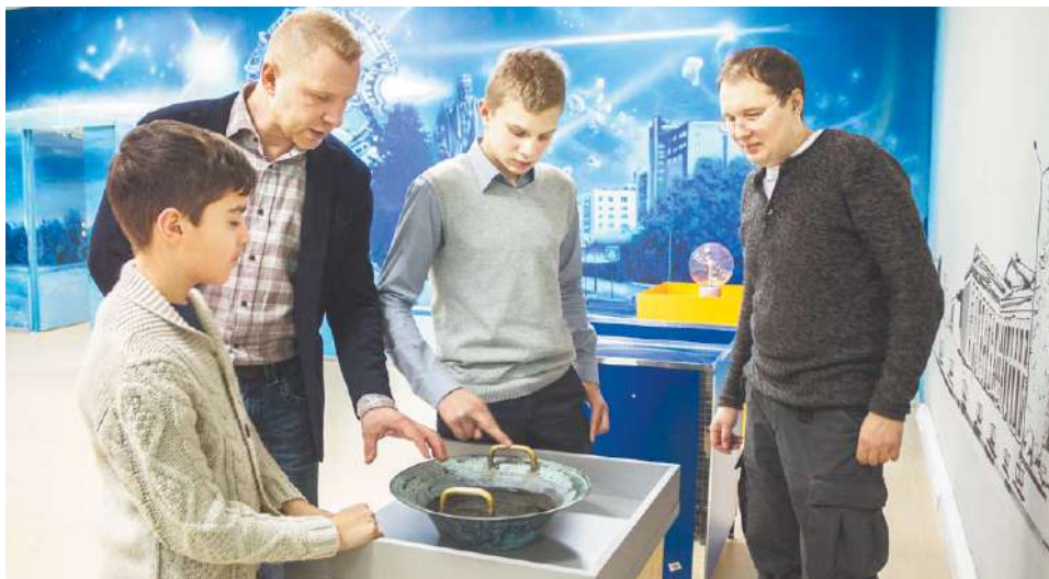
В науке важна преемственность

Такие изменения не только улучшат экономическую ситуацию в городе, но и помогут решить вопросы с жильём, транспортом, медицинским обслуживанием и т.д. Всё это весьма важно для развития Королёва, поэтому в программу стратегии уже заложены конкретные решения данной задачи и чёткие планы её реализации.