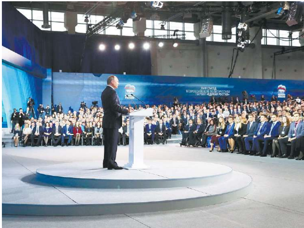
Президент России Владимир Путин выступил перед делегатами съезда

«Я уверен в нашем успехе, потому что с нами – миллионы граждан России».