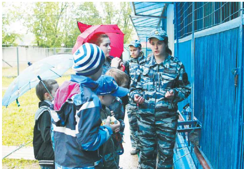
Для воспитанников «Заботы» организуют самые разные экскурсии

На детство этих мальчишек и девочек набросила свою тень сложная взрослая жизнь. И сотрудники центра стараются показать детям и подросткам, как можно жить радостно, позитивно, ставя перед собой задачи и решая их... Кроме того, здесь всегда много сил и времени уделяют тому, чтобы дети видели жизнь не только сквозь призму ярких спектаклей, но и учились элементарным вещам – умели правильно оформлять документ (например, написать заявление), вести хозяйство: испечь пироги или помыть посуду.