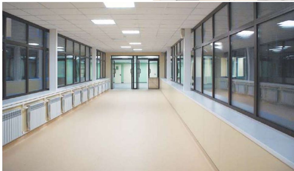
Переход после ремонта стал чистым и светлым

Благодаря заинтересованности руководителей, вновь образованная Королёвская городская больница стала комфортабельным, современным медицинским учреждением, оснащённым по последнему слову техники. Стены больничных зданий внутри обшиты материалом Ingermax отечественного производства. Эти стеновые панели пригодны для регулярной санитарной обработки, поскольку материал был разработан специально для медицинских учреждений.