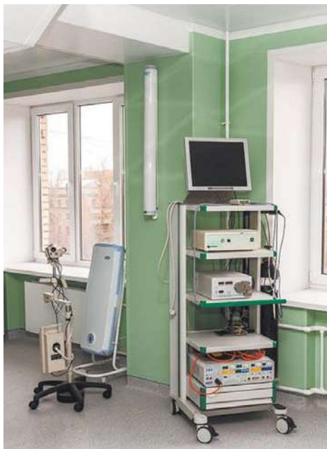
Новая аппаратура в отделении гинекологии

Ремонт отделения Королёвской городской больницы в мкр Текстильщик намечен на начало 2018 года