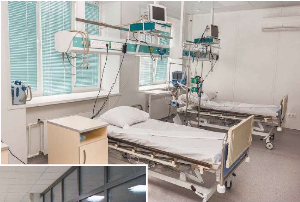
В отделении реанимации

Губернатор Московской области называет медицину приоритетной сферой. Андрей Воробьёв много внимания уделяет тому, чтобы подмосковные клиники вышли на современный уровень. И сегодняшние преобразования в городской сфере здравоохранения стали возможны благодаря включению нашего наукограда в региональную программу капитального ремонта медицинских учреждений.